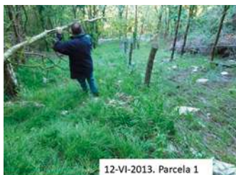
Figura 8. Efecto del pastoreo y regeneración posterior a una carga de 13,5 cerdos/ha.