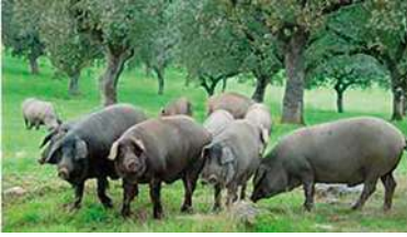
Figura 2. Ejemplares de cerdos ibéricos, tronco mediterráneo

El interés se centró en la tecnificación y los aspectos medioambientales apenas eran tenidos en cuenta. El auge de la producción intensiva llegó a su término a finales del siglo XX debido a los problemas medioambientales que plantea: contaminación de las aguas (eutrofización) y del aire (vinculado al cambio climático), unido a los conceptos de sostenibilidad, producción sostenible y producción ecológica.