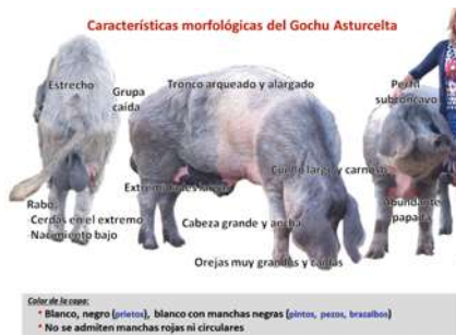
Figura 5. Características morfológicas de la raza porcina Gochu Asturcelta