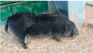
Figura 1. Ejemplar de la raza Negro Canario. Única raza porcina autóctona del Archipiélago, incluida en el Catálogo Oficial de las Razas Ganaderas de España

Con el tiempo, se fueron diferenciando dos troncos raciales: tronco Celta en la mitad N-NE y tronco Ibérico en la S-SW; este último es actualmente el tronco Mediterráneo, que incluye a los cerdos autóctonos de Baleares y Canarias (Figura 1). Aunque la distribución racial de estos troncos nunca ha estado delimitada por una línea excluyente, podría decirse que se corresponde con una línea que, partiendo de la desembocadura del Miño, llegaba hasta Valencia, predominando al norte de esta línea los cerdos del tipo “céltico” y en la sur los del tipo “ibérico”.