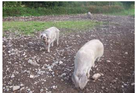
Figura 6. Ejemplares porcinos de Gochu Asturcelta

Su carácter dócil, rústico, productivo y de fácil adaptación al medio agreste y húmedo con épocas de escasez de alimentos, les permite ser explotadas al aire libre. Estos animales fueron durante cientos de años una de las herramientas en las que se sustentó su supervivencia en las caserías. En una sociedad rural en la que la ganadería principal estaba constituida por rumiantes, el cerdo era un complemento que ayudaba a mantener la biodiversidad y el aprovechamiento racional de los alimentos obtenidos de pastos y montes con la máxima eficiencia, utilizando el estrato subarbustivo y herbáceo del sotobosque durante el verano y los frutos del bosque (castañas, bellotas y hayucos, entre otros) durante otoño e invierno.