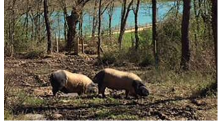
Figura 4. Ejemplares porcinos de Euskal Txerria, que tiene su origen en la parte occidental de los Pirineos