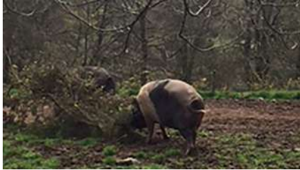
Figura 3. Ejemplares porcinos de Raza Celta

caso de animales para cebo, por su capacidad para el aprovechamiento de los ecosistemas forestales, que permite mantener un equilibrio estable entre la conservación de los recursos naturales y la biodiversidad, con la necesidad del hombre de aprovechar los mismos recursos.